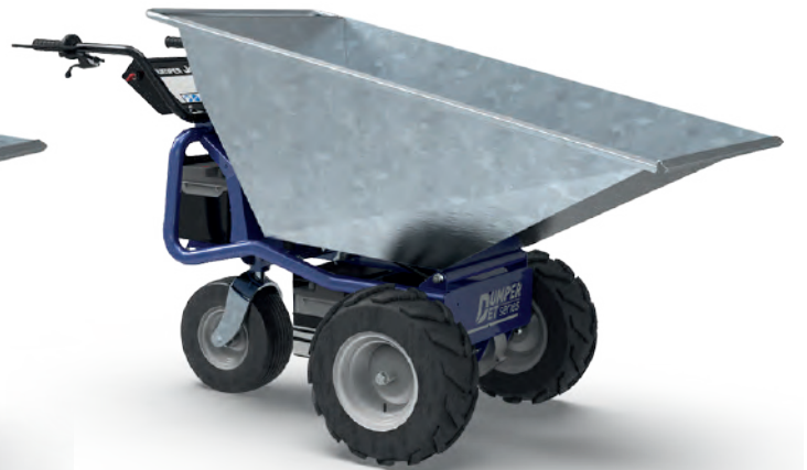
CUVE 250 L