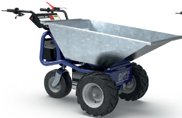
CUVE 180 L

DUMPER-JET peut compter sur une grande gamme de plateaux et cuves de différentes dimensions pour toutes demandes de transport. Il est aussi possible d'appliquer sur la cuve un kit de attelages pour enlever la machine, par exemple en utilisant une grue.