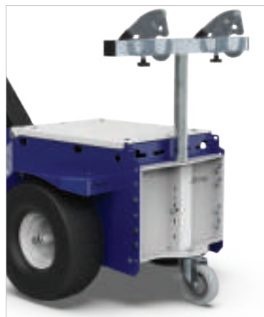
ATTELAGE POUR POUBELLES