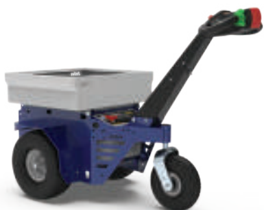
PANIER 650 x 550 x 150 mm