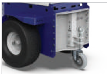
ATTELAGE AVEC BOULE - TIGE Ø20 - 25 mm