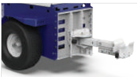
ATTELAGE POUR CHARIOTS ROLL-BOX