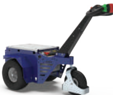
PROTECTION POUR ROUE PIVOTANTE