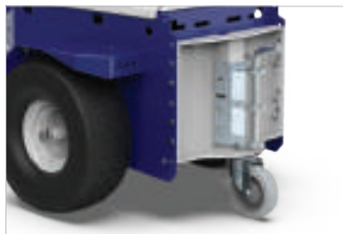
ATTELAGE À GOUPILLE Ø16 - 20 - 35 - 40 mm