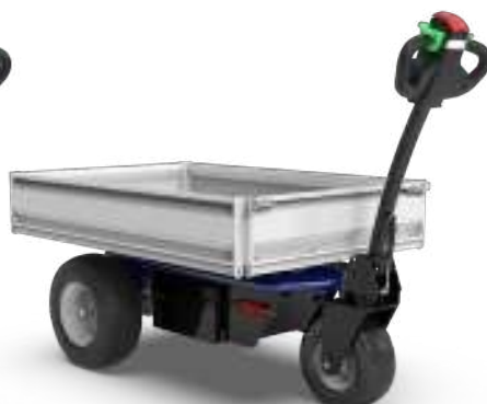
PLATEFORME 890 x 1325 x 185 mm