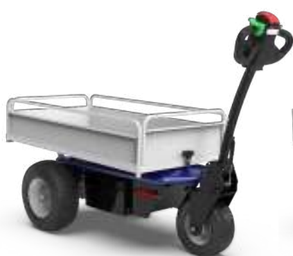
PLATEFORME 695x1250xh230 mm

TR30 dispose d'une large gamme de plateaux de charge de différentes tailles pour répondre à tous les besoins de transport. Tous les plateaux standard ont des cotes qui peuvent être retirés sur 3 cotés pour faciliter le chargement du matériel . De plus, il est possible d'appliquer n'importe quel équipement ou machine personnalisé sur le TR30 .