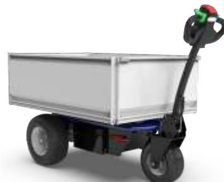
PLATEFORME 890 x 1325 x 385 mm