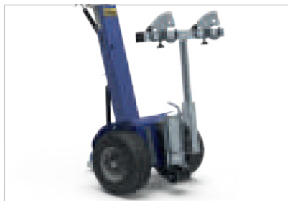
ATTELAGÉ POUR POUBELLES