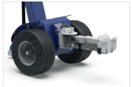
CROCHET RÉGLABLE POUR ROLL BOX