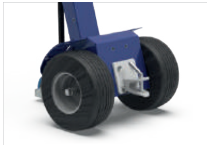
ATTELAGÉ À GOUPILLE