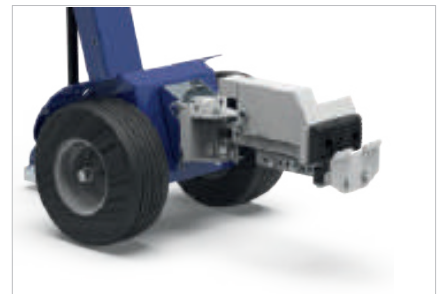
CROCHET À PINCE ÉLECTRIQUE