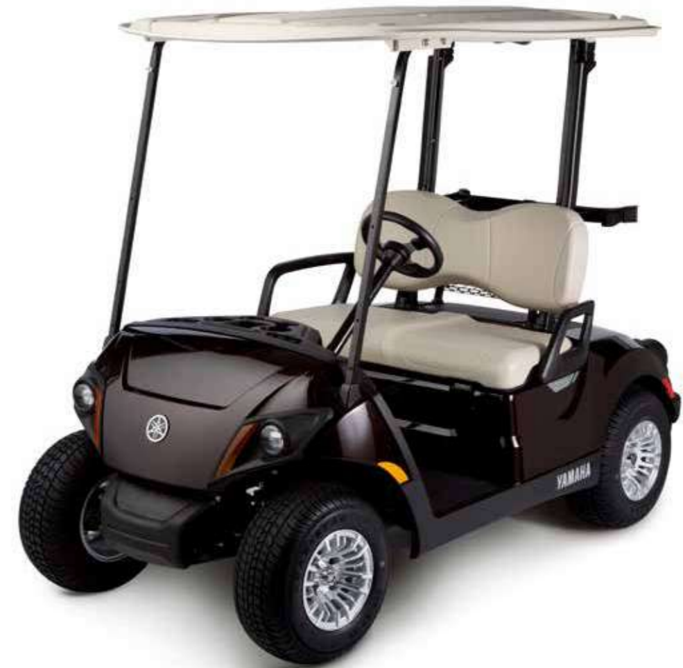
Ce modèle est présenté avec des accessoires en option